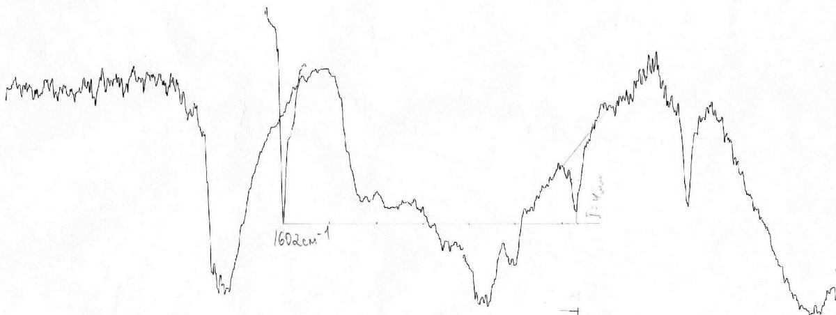
Рис. 2. Приклад робочої частини ІЧ-спектра саломасу марки 2 з алюмосилікатним каталізатором після обробки УФ-випромінюванням з фільтром 230 нм

Експеримент проходив за температури 220–240 °С, 1,5 год, з використанням алюмосилікатного каталізатору, подібно до минулого експерименту, але з УФ-фільтром в 230 нм (табл. 8).