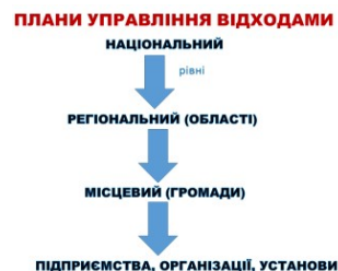
Рис. 3. Узагальнена класифікація-ідентифікація ієрархії управління відходами

Нове законодавство передбачає рух від державного плану управління відходами аж до планів управління відходами підприємств. Плани управління відходами розробляються на національному, регіональному та місцевому рівнях, а також на рівні підприємств, організацій та установ (рис. 3).